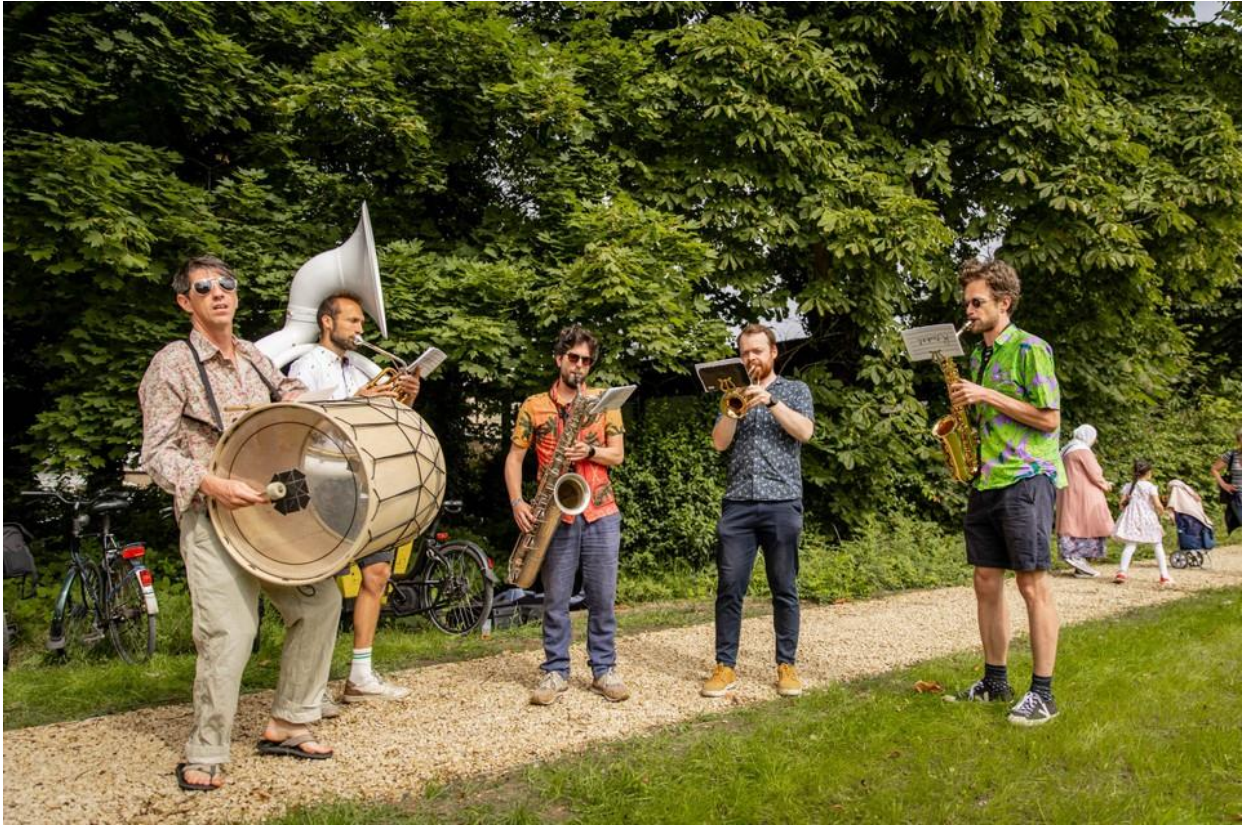
De feestelijke opening van het SteenWegPark.