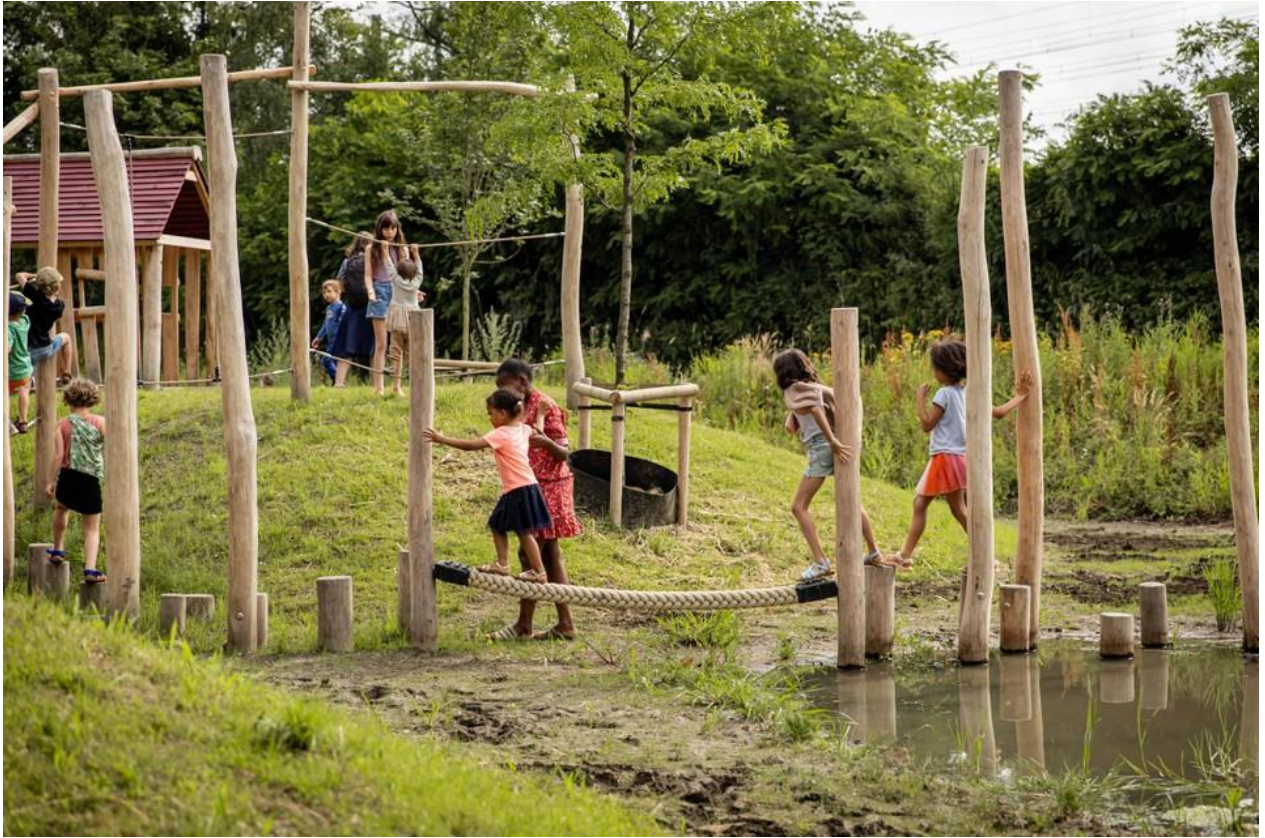
Het nieuwe SteenWegPark heeft ook speelheuvels.