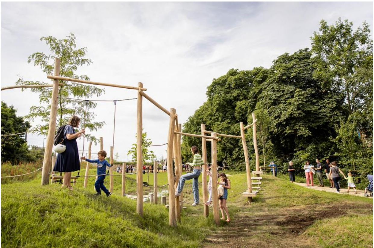
Het nieuwe SteenWegPark.