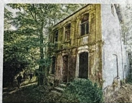
De vervallen tuinierswoning wordt een vakantiewoning.