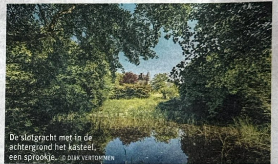
De slotgracht met in de achtergrond het kasteel, een sprookje.

“Net zoals Filips de Goede, een van de vroegere eigenaars van De Borgh, willen wij hier een hofhouding samenbrengen die zal bestaan uit investeerders, overheden en bedrijven die hun CO 2 -uitstoot willen compenseren, maar ook uit filosofen, wetenschappers, landschapsarchitecten, botanici, kunstenaars, landbouwers en koks”